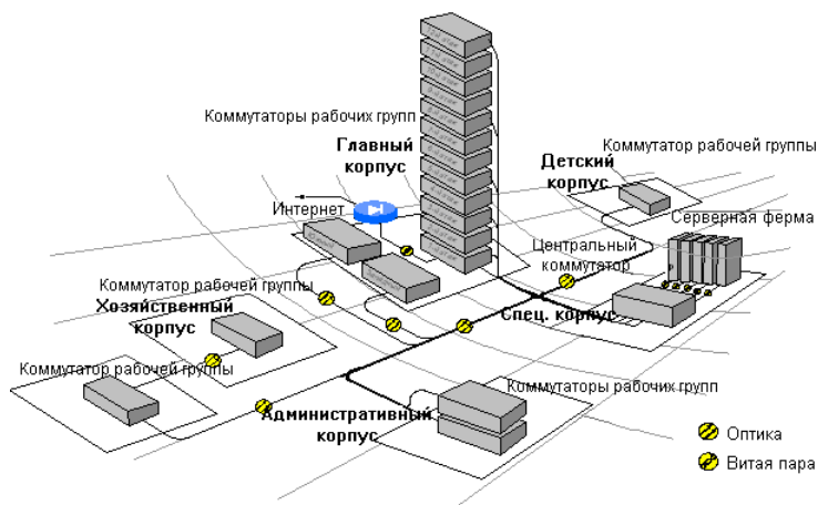
Рис. 3. Схема локальной вычислительной сети

были выдержаны и все задачи, которые были отражены в техническом задании, выполнены. Информация обо всех оговоренных аспектах деятельности ЛПУ в настоящее время находит свое отражение в Медицинской информационной системе.