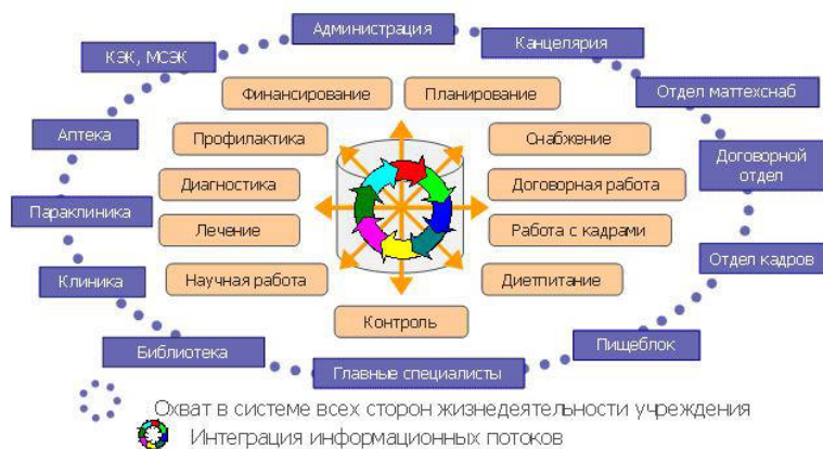
Рис. 2. Стратегия интеграции информационных потоков в технологии Интернет

На базе технологии ИНТЕРИН были разработаны и успешно внедрены в промышленную эксплуатацию информационные системы управления ряда крупных ЛПУ, в числе которых: